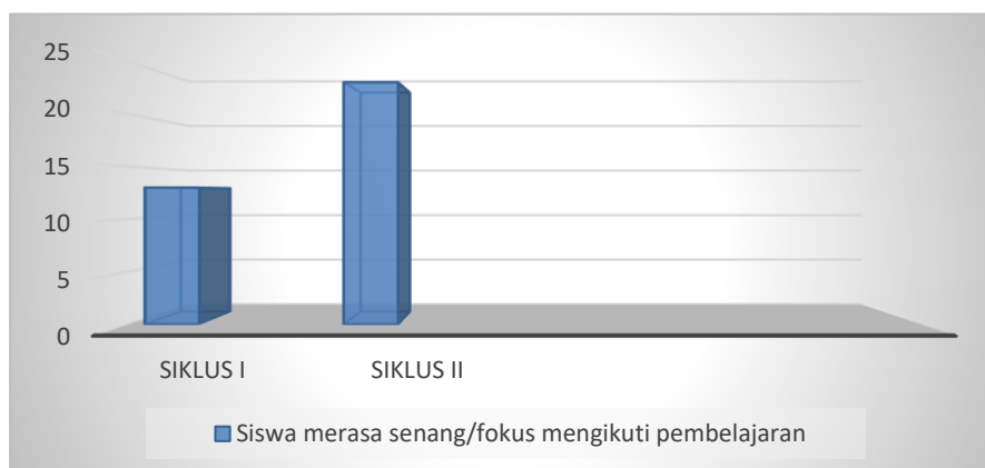
Gambar 1. Dorongan dan kebutuhan dalam belajar

Berdasarkan data yang ditampilkan dalam tabel, motivasi belajar siswa menunjukkan peningkatan yang signifikan pada indikator dorongan dan kebutuhan dalam belajar. Dari total 27 siswa kelas VII.4, sebanyak 23 siswa mengikuti pembelajaran pada siklus I. Hasil observasi menunjukkan bahwa dalam siklus I, terdapat 13 siswa (48,14%) yang merasa senang dan fokus dalam mengikuti proses pembelajaran. Pada siklus II, partisipasi siswa meningkat, dengan 26 dari 27 siswa mengikuti pembelajaran. Data menunjukkan bahwa jumlah siswa yang merasa senang dan fokus dalam pembelajaran meningkat menjadi 23 siswa, dengan persentase sebesar 85,18%. Hal ini mengindikasikan bahwa penerapan metode active learning "Team Quiz" memiliki dampak positif dalam meningkatkan motivasi belajar siswa pada mata pelajaran PAIBP.