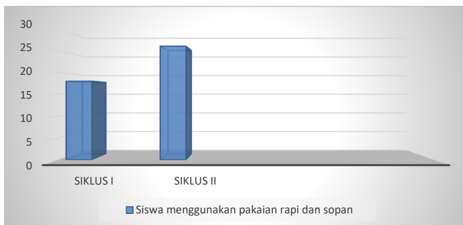
Gambar 4. Kedisiplinan

Berdasarkan diagram yang telah disajikan, hasil observasi menunjukkan bahwa tingkat kedisiplinan siswa mengalami peningkatan pada siklus I dan siklus II, khususnya dalam aspek kepatuhan terhadap aturan berpakaian yang rapi dan sopan. Temuan ini mengindikasikan bahwa penerapan metode active learning "Team Quiz" berkontribusi dalam membentuk karakter disiplin peserta didik dalam pembelajaran PAIBP. Peningkatan ini menunjukkan bahwa strategi pembelajaran yang lebih interaktif mampu memberikan dampak positif terhadap sikap dan perilaku siswa dalam mengikuti proses pembelajaran secara lebih tertib dan sesuai dengan norma yang telah ditetapkan.