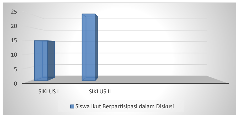
Gambar 2. Kegiatan Menarik dalam Belajar

Berdasarkan diagram yang telah disajikan, hasil observasi menunjukkan bahwa partisipasi siswa dalam diskusi mengalami peningkatan pada siklus I dan siklus II. Indikator keterlibatan dalam kegiatan menarik dalam belajar terlihat semakin meningkat setelah diterapkan metode active learning "Team Quiz". Temuan ini mengindikasikan bahwa penerapan metode active learning "Team Quiz" berkontribusi terhadap peningkatan interaksi serta partisipasi aktif peserta didik dalam pembelajaran PAIBP. Hal ini menunjukkan bahwa strategi pembelajaran yang lebih interaktif mampu memberikan dampak positif terhadap motivasi dan keterlibatan siswa dalam proses belajar.