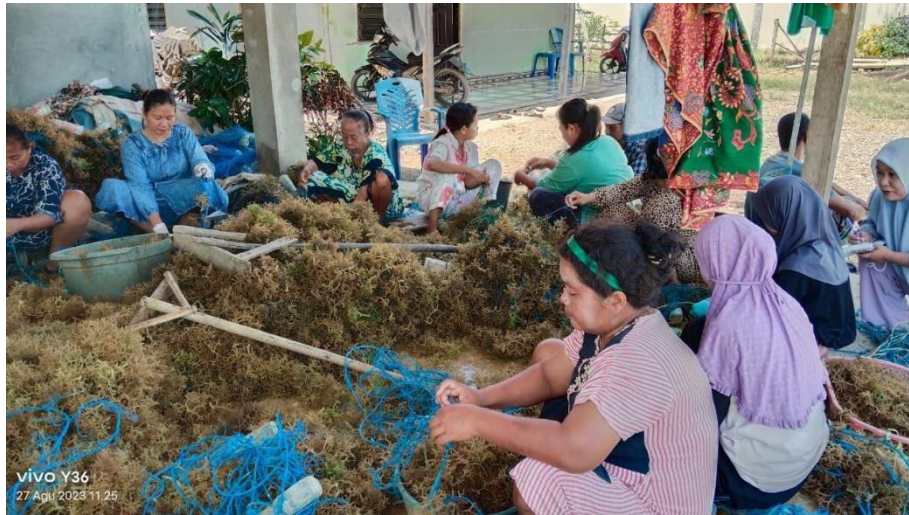
Gambar 2. Mengikat Rumput Laut ( Massioh, Maggattung )

dari jasa mengikat bibit rumput laut belum mencukupi dan hanya sekedar pekerjaan sampingan. Rata-rata penghasilan yang diperoleh mengikat bibit rumput laut berkisar Rp 50.000- 350.000 per minggu. Ada yang sudah lebih dari 10 tahun, ada juga yang baru 1 tahun, 2 bulan bekerja sebagai buruh pengikat.