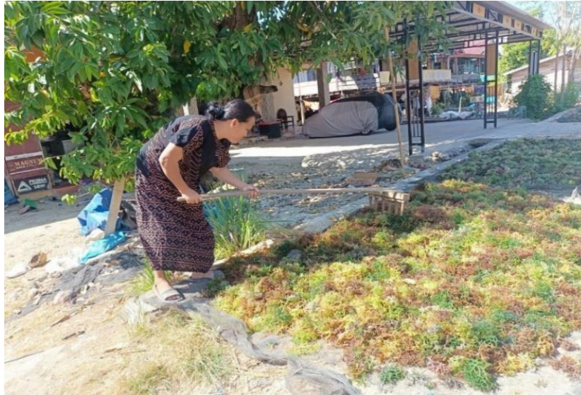
Gambar 3. Menjemur Rumput Laut ( Mangessoh )