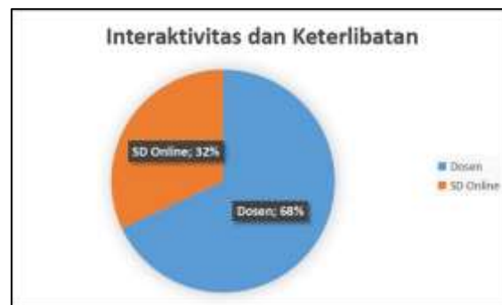
Gambar 2. Preferensi Interaktivitas dan Keterlibatan

Hasil penelitian tersebut menggambarkan bahwa terdapat perbedaan preferensi di antara mahasiswa terkait dengan interaktivitas dan keterlibatan dalam pembelajaran bahasa Arab. Sebagian mahasiswa, sebanyak 32%, cenderung lebih memilih penggunaan sumber daya online yang memungkinkan mereka untuk berinteraksi dan terlibat langsung dalam proses pembelajaran. Sementara itu, mayoritas, yaitu 68% dari responden, lebih memilih dosen sebagai fasilitator pembelajaran yang mampu melibatkan mereka secara langsung dalam pembelajaran bahasa Arab. Hasil ini menunjukkan adanya kebutuhan akan pendekatan pembelajaran yang menggabungkan elemen-elemen interaktif dan keterlibatan mahasiswa untuk memfasilitasi pemahaman yang lebih baik.