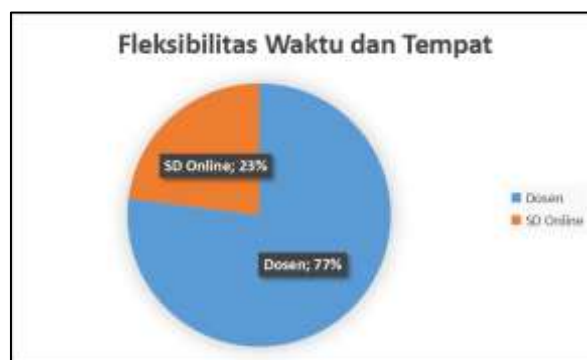
Gambar 4. Preferensi Fleksibilitas Waktu dan Tempat

Hasil penelitian yang disajikan dalam Gambar 4 menunjukkan bahwa mayoritas mahasiswa, sebanyak 77%, percaya bahwa dalam pembelajaran bahasa Arab, peran dosen memiliki keunggulan dalam hal fleksibilitas waktu dan tempat. Sebaliknya, hanya 23% mahasiswa yang percaya bahwa sumber daya online lebih fleksibel dalam hal waktu dan tempat.