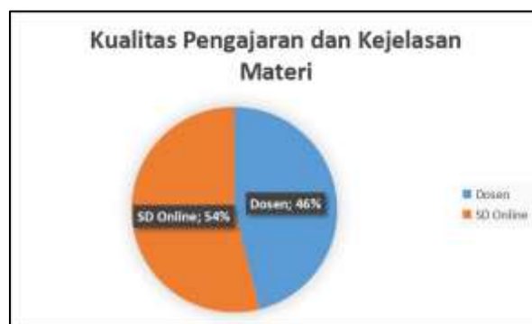
Gambar 3. Preferensi Kualitas Pengajaran dan Kejelasan Materi

Hasil penelitian menunjukkan bahwa terdapat kesetaraan yang hampir sama antara preferensi mahasiswa terkait kualitas pengajaran dan kejelasan materi dalam pembelajaran bahasa Arab melalui sumber daya online dan melalui tatap muka dengan dosen pengampu. Sebanyak 54% mahasiswa memilih sumber daya online sebagai sumber utama dalam hal kualitas pengajaran dan kejelasan materi, sementara 46% memilih dosen pengampu melalui tatap muka.