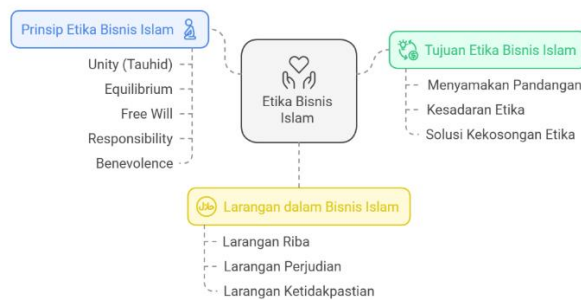
Gambar 1. Skema Etika Bisnis Islam

benevolence . 23 Selain itu, menurut Li Jie et al (2023) prinsip etika bisnis berdasar Al-Qur'an ialah: larangan melakukan bisnis yang rusak, larangan terhadap praktik riba, perjudian dan ketidak pastina, memuat fungsi sosial, tidak ada pemaksaan, menjunjung tinggi keadilan serta meniadakan pendzoliman. 24