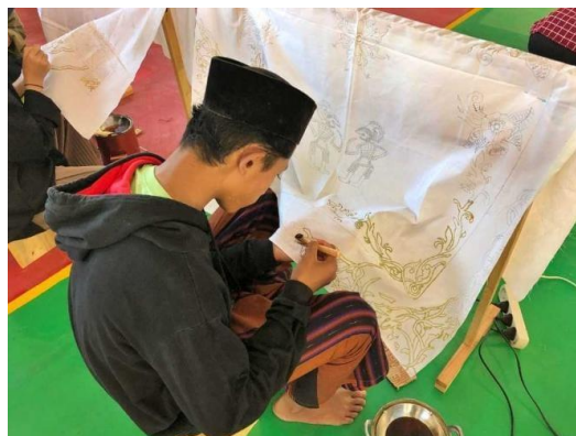
Proses mencanting dengan lilin malam