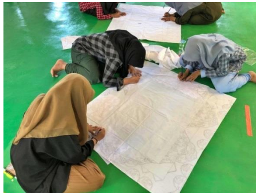
Pembuatan Sketsa Batik

Proses pembuatan batik diawali dengan perancangan desain atau motif batik. Desain tersebut terlebih dahulu digambar pada kertas kope'an (layangan), kemudian dijiplak ke kain katun jenis primisima. Selanjutnya, tahap penulisan batik dilakukan dengan menggunakan canting. Setelah tahap penulisan selesai, kain batik melalui proses pewarnaan. Kemudian, lilin malam yang menempel pada kain dilunturkan dengan cara merendamnya dalam air mendidih. Tahap akhir dari proses produksi ini adalah penjemuran kain hingga kering.