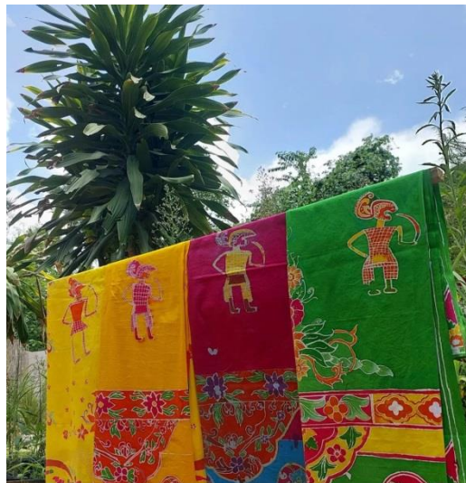
Penjemuran kain batik

Dalam proses produksi batik gungsumi, partisipasi semua elemen dalam pesantren menjadi kekuatan utama dalam pengembangan batik berbasis kearifan lokal. Santri berperan sebagai tenaga pelaksana utama dalam produksi batik yang melibatkan aktivitas dari perancangan pola hingga finishing produk. Keterlibatan aktif ini tidak hanya sebagai sarana pengembangan keterampilan, tetapi juga sebagai media pendidikan karakter, dimana mereka belajar tentang kerja keras, ketelitian, dan tanggung jawab. Untuk pembuatan batik dilaksanakan di Balai Latian Kerja Komunitas (BLKK). Dengan adanya kegiatan batik tulis, santri