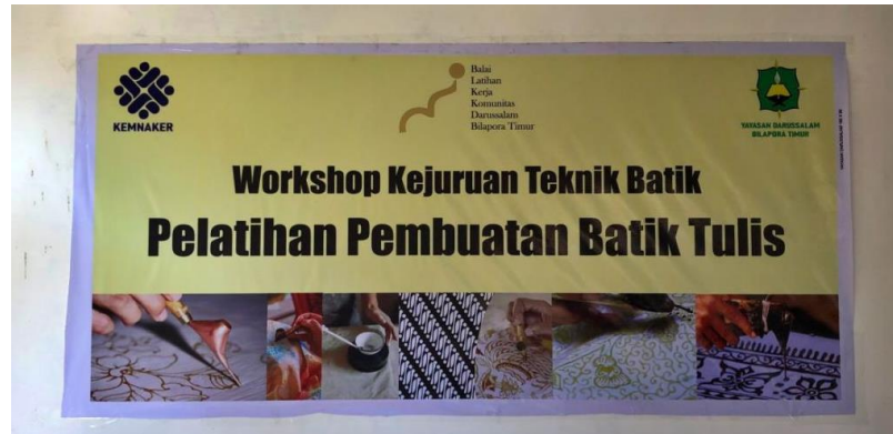
Tempat lokakarya BLKK Darussalam

memperoleh kesempatan untuk melakukan praktik kerja, sehingga dapat mengintegrasikan pembelajaran agama dengan pendidikan kewirausahaan secara seimbang.