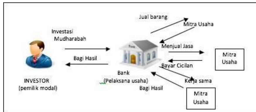
Skema Penghimpunan dan penyaluran dana