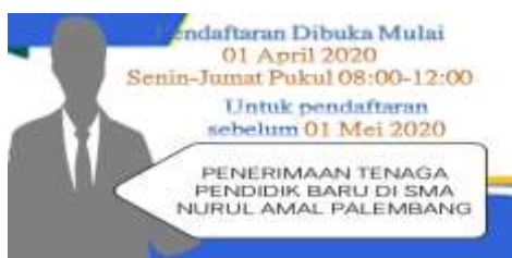
Gambar 2. Dokumentasi penyebaran pengumuman rekrutmen

Berdasarkan beberapa hasil wawancara yang dilakukan, peneliti dapat menarik kesimpulan bahwa penyebaran pengumuman rekrutmen tenaga pendidik dilakukan oleh pihak sekolah melalui media online yang sering digunakan seperti Facebook, Instagram, Whatsapp. Selanjutnya bisa juga melalui obrolan dari satu pihak ke pihak lain karena keterbatasan biaya dalam penyebaran pengumuman hanya seadanya, contohnya ada kerabat dari salah satu guru yang baru lulus, itu kami tawarkan untuk mengajar di sekolah. Hal itu diperkuat dengan dokumentasi berikut: