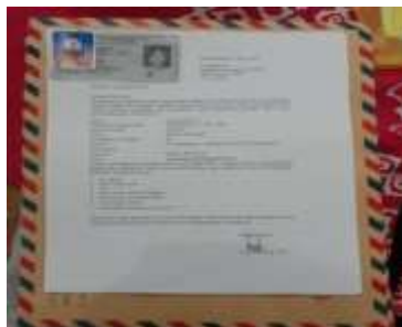
Gambar 1. Dokumentasi persyaratan berkas calon pelamar.

memiliki kualifikasi akademik dan kompetensi sebagai agen pembelajaran, sehat jasmani dan rohani, serta memiliki kemampuan untuk mewujudkan tujuan pendidikan nasional. Hal itu dapat diperkuat dengan adanya dokumentasi persyaratan pelaksanaan rekrutmen tenaga pendidik di SMA Nurul Amal Palembang sebagai berikut: