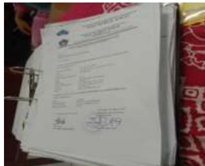
Gambar 4. Dokumentasi proses pengumpulan berkas rekrutmen

Berdasarkan beberapa hasil wawancara yang dilakukan, peneliti dapat menarik kesimpulan bahwa Proses Pengumpulan Berkas Calon Pelamar pihak panitia menyusun persyaratan berkas yang telah ditentukan, selanjutnya pihak panitia memeriksa berkas calon pelamar satu persatu dan sistem verifikasi berkas yang diterima oleh pihak sekolah dilihat melalui mengkoreksi satu persatu berkas yang sudah diterima. Hal itu diperkuat dengan hasil dokumentasi sebagai berikut: .