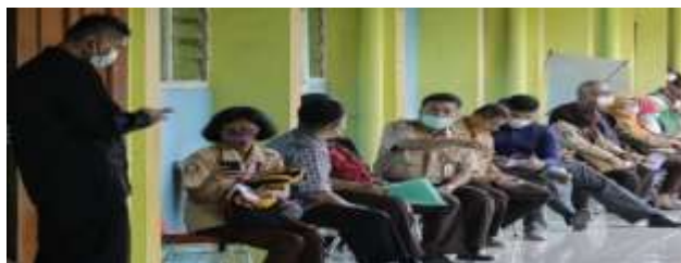
Gambar 5. Dokumentasi sistem seleksi pelamar