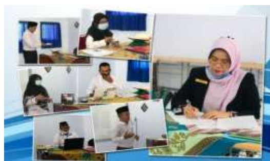
Gambar 6. Dokumentasi proses seleksi pelamar

Berdasarkan beberapa hasil wawancara yang dilakukan, penulis dapat menarik kesimpulan bahwa pihak sekolah melakukan pemeriksaan persyaratan administrasi karena seleksi pertama yang harus ditempuh oleh bagian seleksi tenaga calon tenaga pendidik baru. Hal itu dapat diperkuat dengan hasil dokumentasi sebagai berikut: