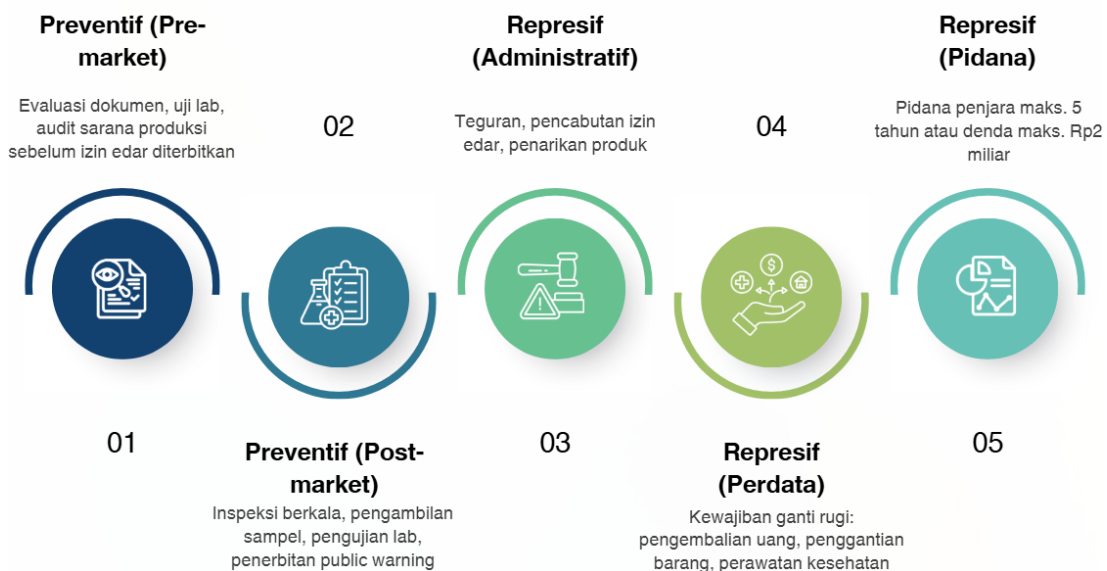
Gambar 2. Bentuk Perlindungan Hukum Konsumen

Hubungan hukum antara konsumen dan pelaku usaha melahirkan kewajiban bagi pelaku usaha untuk bertanggung jawab atas kerugian yang dialami konsumen. 30 Dalam sejarah hukum perlindungan konsumen, posisi ini terbentuk oleh beberapa doktrin yang berkembang dari waktu ke waktu. Awalnya berlaku doktrin caveat emptor yang menganggap konsumen dan pelaku usaha berada dalam posisi seimbang. Doktrin ini kemudian digantikan dengan prinsip kehati-hatian di sisi pelaku usaha ( caveat venditor ), yang diwujudkan dalam larangan-larangan bagi pelaku usaha pada Pasal 8 hingga Pasal 17