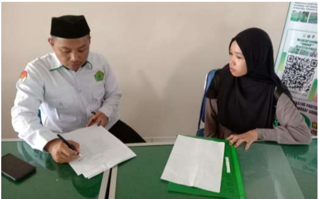
IV. Wawancara Bersama Wakamad Bidang Kurikulum