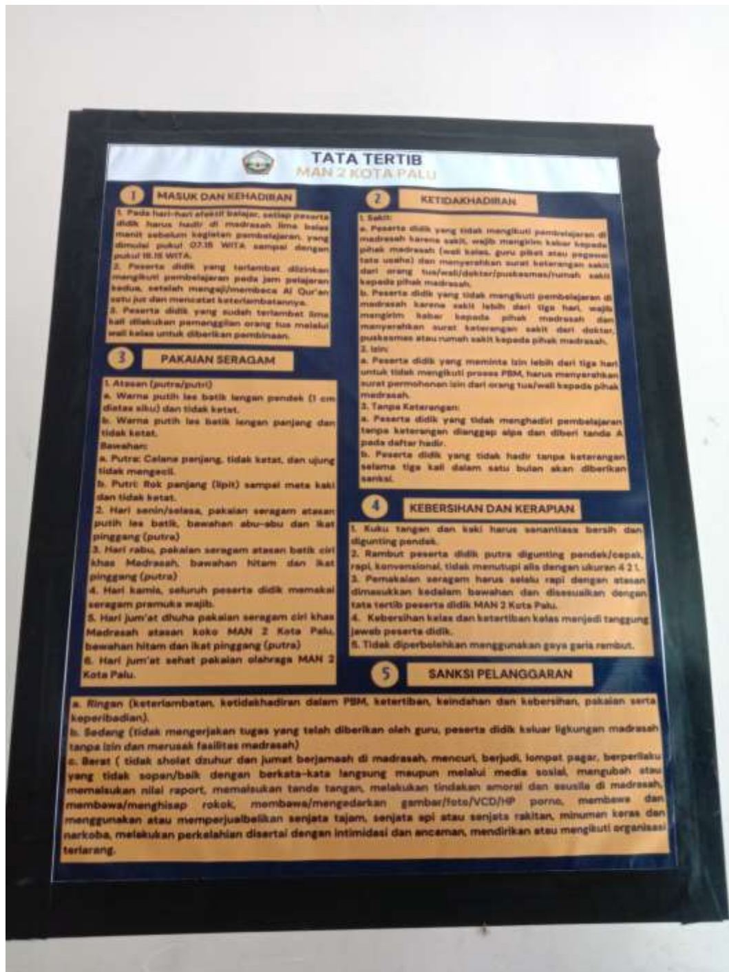
XI. Tata Tertib MAN 2 Kota Palu