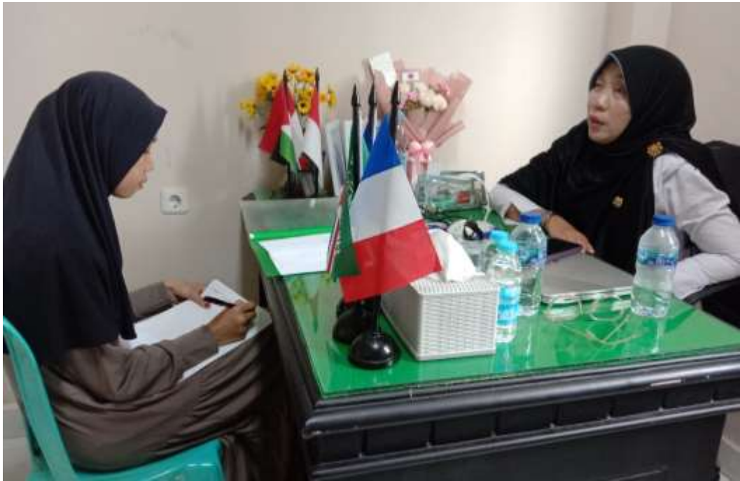
III. Wawancara Bersama Plt Kepala MAN 2 Kota Palu