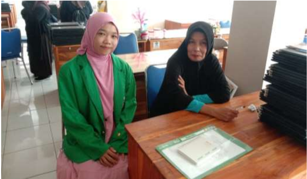
V. Wawancara Bersama Guru Ushul Fiqih