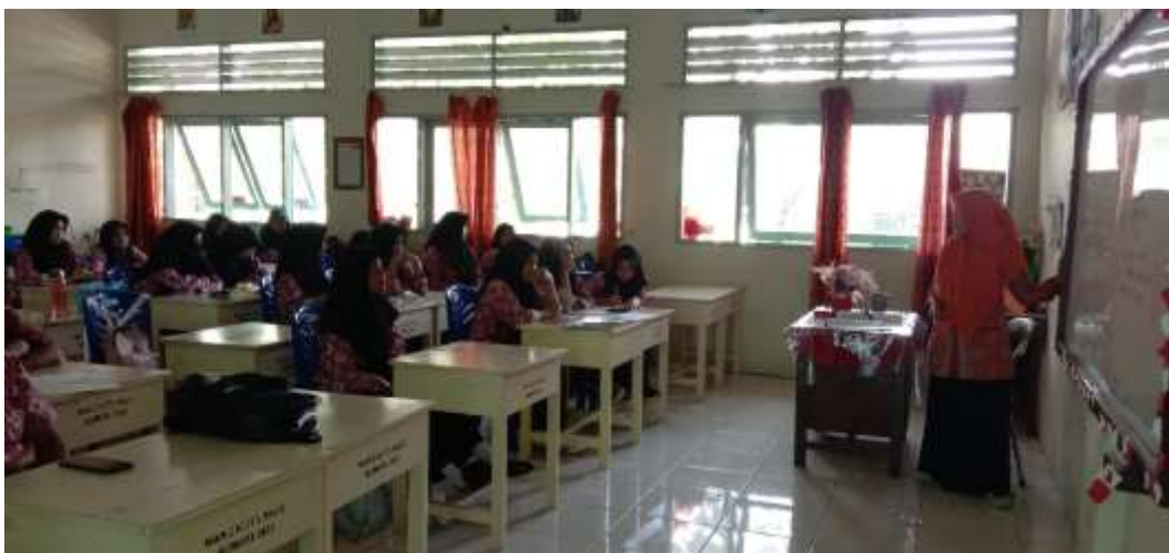
VII. Dokumentasi Pembelajaran Ushul Fiqih